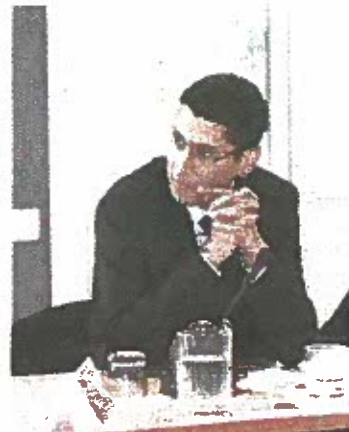
Boulhamane ne lâche rien.