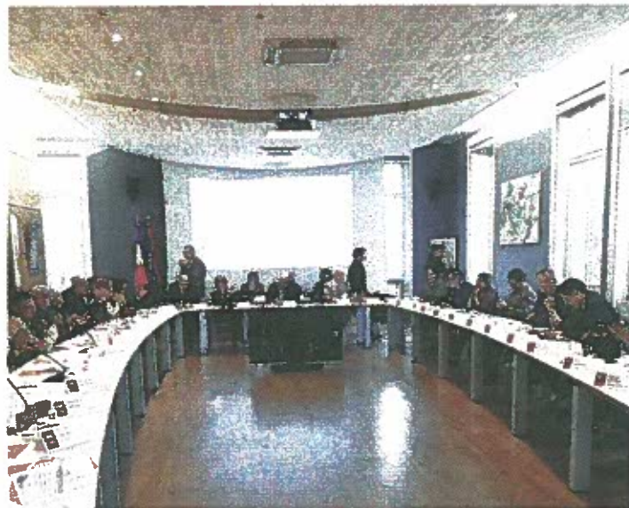
Le 1er conseil municipal de la mandature 2014-2020 a annoncé la couleur.