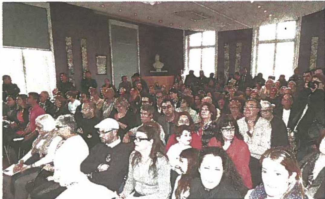
Un public nombreux dans la salle du conseil avec les sympathisants des deux camps.